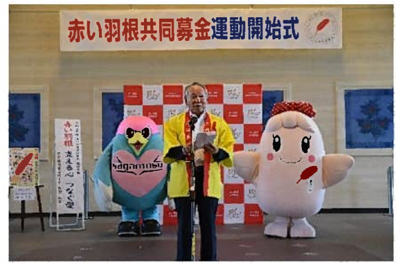
陣内会長が運動開始を宣言