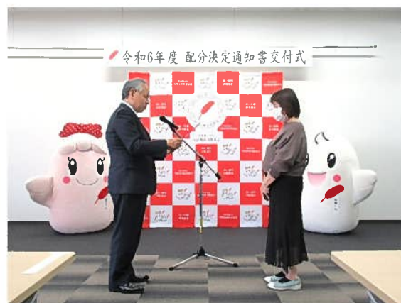
配分決定通知書交付の様子