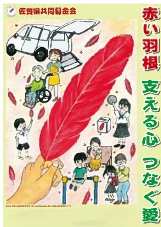
デザイングランプリ作品