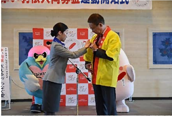
佐賀空港グランドスタッフが 佐賀県副知事に赤い羽根を着甲する様子