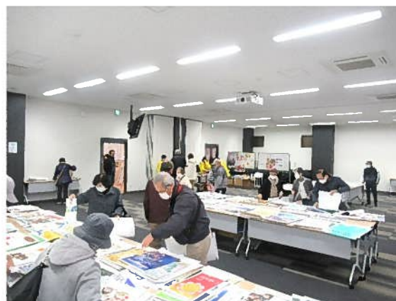
カレンダーバザーの様子