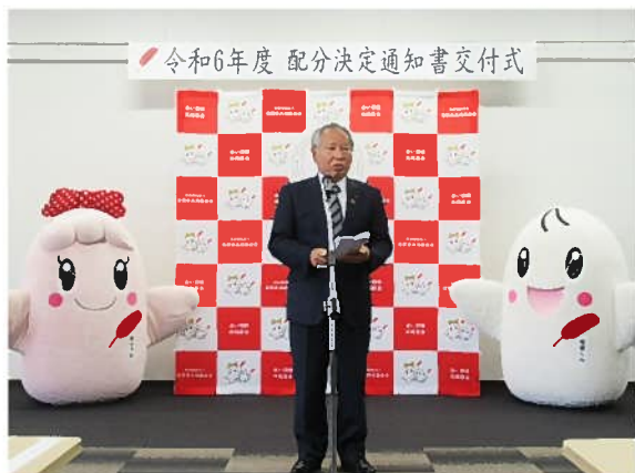
陣内会長による開会の挨拶