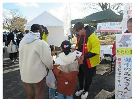
駅前不動産スタジアムでの募金活動の様子