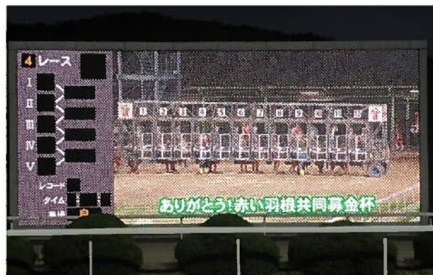
佐賀競馬場での募金活動の様子