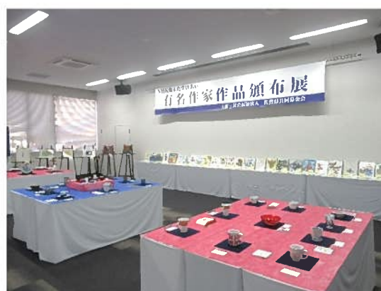
有名作家作品頒布展の様子